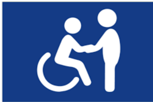
ASYSTENT OSOBISTY OSOBY NIEPEŁNOSPRAWNEJ

Celem programu jest zapewnienie wsparcia w wykonywaniu codziennych czynności oraz funkcjonowania w życiu społecznym osób z niepełnosprawnością i prowadzenia bardziej samodzielnego i aktywnego życia. Asystenci udzielają wsparcia zarówno w miejscu zamieszkania jak i poza nim. Osoby z niepełnosprawnością mogą odbywać wycieczki, bywać w kinie i w sklepach. Asystenci towarzyszą im na treningach i rehabilitacji oraz w codziennym funkcjonowaniu.